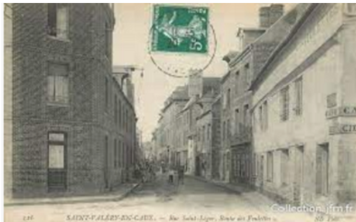
(Rue Saint Léger Saint Valery en Caux)