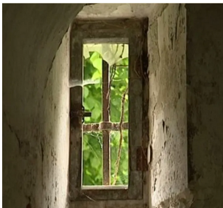
(Fenêtre de prison)

Elle accueillera plus de 500 condamnés des deux sexes dans les anciens bâtiments. En 1817, on aménage un premier atelier de tissage. Dans ces ateliers seront aussi fabriqués des chausses, des chaises, des tapis, de la peausserie, broserie et cordonnerie. En 1820, un quartier correctionnel pour mineurs et un quartier pour les femmes sont ouverts. Dans ce lieu, d'après le docteur Vingtrinier de Rouen, on constate 614 décès entre 1817 et 1825. En 1839, les dernières femmes prisonnières du lieu partent de Gaillon. La prison fermera définitivement en 1901.