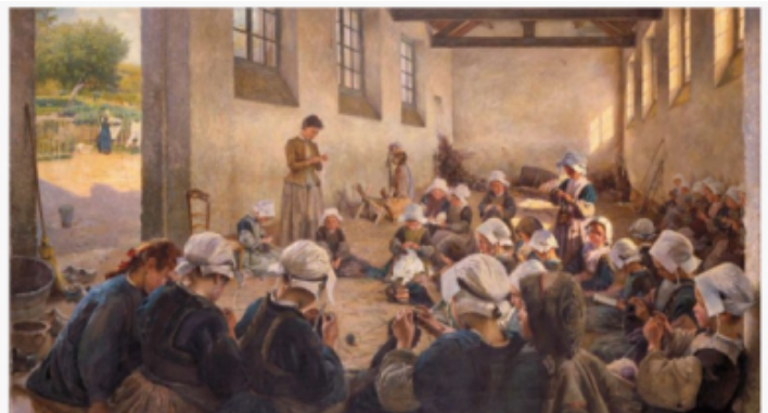
La Classe manuelle. Ecole de petites filles (Finistère). Richard HALL. 1889

Voici un résumé exhaustif de ces métiers d'autrefois au cours des époques. Je me souviens encore voir ma mère faire de la couture dans mon jeune temps. Je l'ai vu travailler les vieux vêtements qui ne correspondaient plus à la taille voulue. Elle les décousait, les retailait puis les bâtissait (couture à gros points) avant essayage pour les coudre en finalité. Que d'heures passées devant sa machine à s'abîmer les yeux !