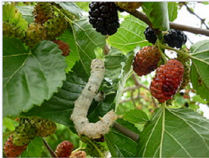
Ver à soie ( Bombyx mori ) sur un Mûrier blanc

Concernant le Pays de Caux, on voit que la culture du mûrier blanc est peu propice à notre région. D'autre part, concernant le ver à soie, il lui faut une température constante de 20 à 22 Â° pendant cinq semaines.