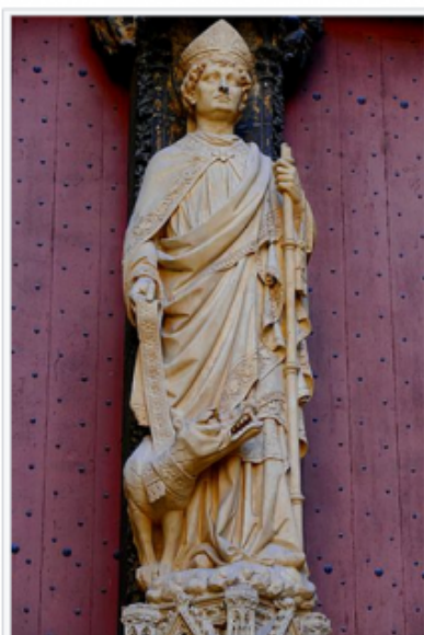
Statue de Saint-Romain, portail des Libraires de la cathédrale Notre-Dame de Rouen.

Une autre fois, étant au Vertbosc, chez le sieur De Bosleville son père, il avait tué un nommé De Blaves qui maltraitait deux lévriers et ne voulait pas les laisser tranquilles, quoiqu'il l'en eût prié plusieurs fois.