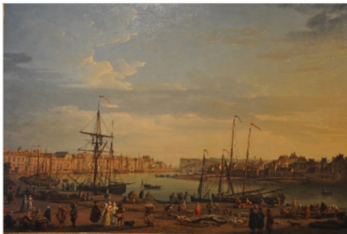
Vue du port de Dieppe en 1765 par Joseph Vernet

La petite fille née le 15 Germinal de l'An II (selon le calendrier grégorien le 4 Avril 1794) reçoit les très originaux prénoms d'Abeille la Raison. Aussi curieux que nous apparaisse le choix d'Abeille pour prénom, il s'explique aisément puisque, dans le nouveau calendrier républicain, instauré le 6 Octobre 1793 et inspiré par Fabre d'Eglantine, chaque jour n'est plus associé à un saint mais à un élément de la nature. Le 15 Germinal est ainsi lié à l'abeille. Si la petite fille était née un jour plus tard, se serait-elle appelée Laitue ?