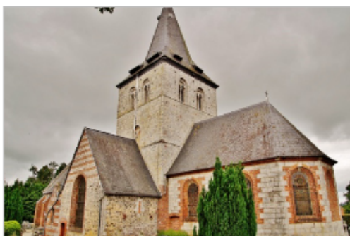
Eglise de Sainte Foy sur Longueville

Ce courrier traite en termes admiratifs du mariage du curé de Sainte- Foy-sur-Longueville, village à une vingtaine de kilomètres de Dieppe, qui compte alors moins de 600 habitants.