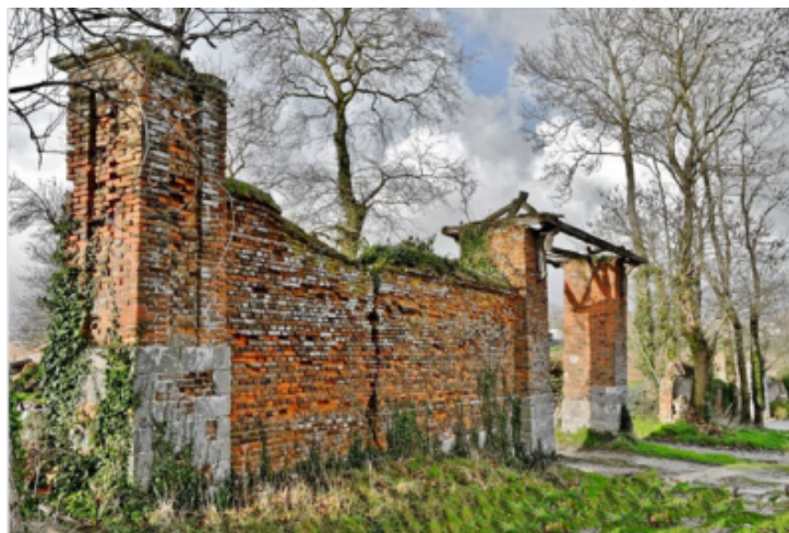
(entrée du château de Néville)