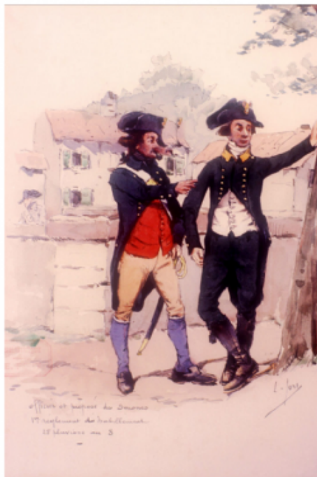
Officier et préposé, An VIII

Certains de nos ancêtres sont particulièrement difficile à localiser et à suivre car ils avaient obligation, de par leur fonction, le droit d'exercer leur emploi loin de leurs terres natales, ceci pour éviter toutes corruptions avec la population. Il en était de même au point de vue du mariage de ces personnes. Impossible de se marier avec une jeune fille de leur village. Il faut donc parfois s'armer de patience ; mais n'est ce pas là la qualité première d'un généalogiste !