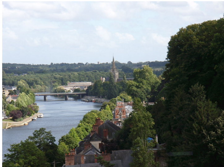
(vue d'Avénières en mayenne)

Avénières ou Avesnières, ancienne commune de la Mayenne, située au sud du centre ville de Laval, composée de plusieurs hameaux, s'étendait entre les deux rives de la Mayenne. L'histoire de l'ancien village d'Avénières située sur la rive droite, point de passage entre les deux rives, est liée à celle de son église du XII ème siècle devenue la basilique Notre Dame en 1898. C'est autour de ce monument, que se concentrent les maisons les plus anciennes habitées autrefois par des tisserands. Les caves servaient au rouissage du lin. Avénières est devenu un quartier de Laval.