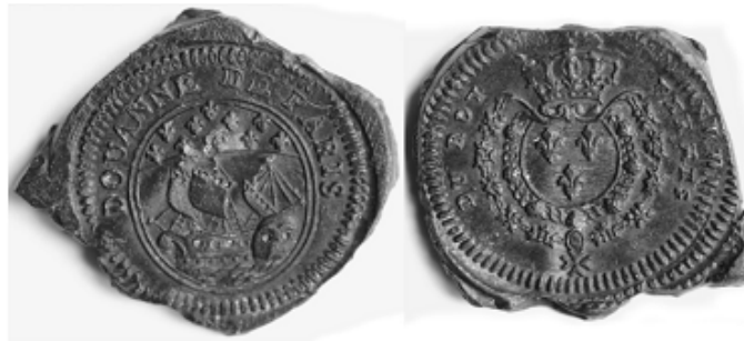
Plomb de Douanes des Fermes du Roy

L'institution de la Ferme Générale fut créé par Louis XIV et mise en place par Colbert en 1681, avec regroupement de plusieurs impôts royaux : aides, gabelles, domaines, traites et entrées. En 1774, la gabelle représente le tiers des revenus de la Ferme générale ; en 1788, elle atteint 51 %. Par la suite, elle fut étendue aux poudres et aux tabacs. Le service central de la ferme a son siège à Paris, à l'hôtel des fermes, rue de grenelle saint honoré. La cartographie pour les cinq grosses fermes fait apparaître 26 directions générales comprenant 1011 bureaux. Ce règlement de 1681 accordait aux employés de la ferme un certain nombre de privilèges.