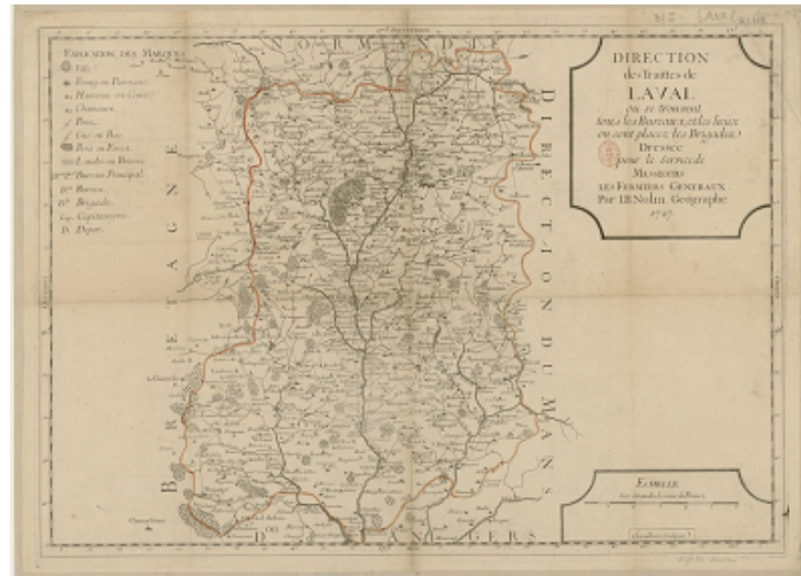
( carte des fermiers généraux de Laval en 1727)

En 1774 le bail de La Ferme Générale assurait 152 millions de livres de recettes à l'État et comptait 87 représentants de la finance aussi dénommés "fermiers généraux". Puissants et fortunés, ils présentaient des cautions financières solides. Pour assurer la levée de l'impôt auprès des français ils étaient amenés à recruter de nombreux employés, aussi dénommés collecteurs. Ces employés sont les prédécesseurs des agents des impôts de l'administration moderne. Pour postuler, il fallait être âgé de 20 ans, être de religion catholique et savoir lire et écrire.