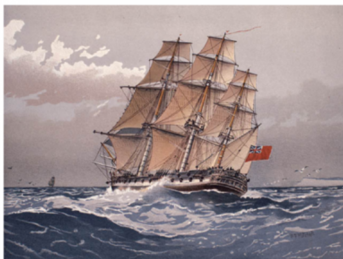
Frégate anglaise vers 1770

Le 14 septembre (27 fructidor an 11), vers 15h, six bâtiments anglais s'approchèrent à une demi-portée de canon du port de Saint Valery en Caux. Ils commencèrent un feu soutenu de bombes et de boulets, dont plusieurs tombèrent à l'intérieur de la ville et ont endommagés quelques maisons. Heureusement, on ne déplora aucun blessé. Après une heure de bombardements, l'ennemi se retira. Le lendemain, ils se présentèrent de nouveau à la vue du port. Les habitants s'attendaient à une attaque aussi terrible que la veille, mais ceux-ci regagnèrent le large. Le 17 septembre, on ne signalait plus de vaisseaux anglais. On évalue à deux cents, le nombre de bombes et de boulets, envoyés par les anglais. Certains boulets faisaient un poids de 32 livres.