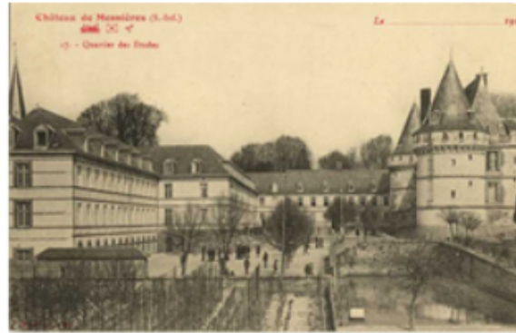
Le Quartier des Etudes, bâtiments ajoutés au XIXème siècle

services aux orphelines, aux jeunes pauvres et aux malades qu'elle visite et qu'elle soulage avec un zèle qui n'est jamais démenti.